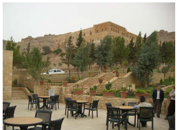
Deyr'ul Zafaran Kloster

Der Europarat ist bereits am Nord/Süd-Dialog beteiligt, mit der Arbeit des North South Centres, das seinen Sitz in Lissabon hat. Die Anna-Lindh-Stiftung in Kairo, die von den Regierungen der Euro-mediterranen Partnerschaft finanziert wird, ist ähnlich am Dialog zwischen den Mittelmeer-Nationen beteiligt. Das Cojep Treffen zum Ost/West-Dialog in Madin war ein Teil des Hauptanliegens der