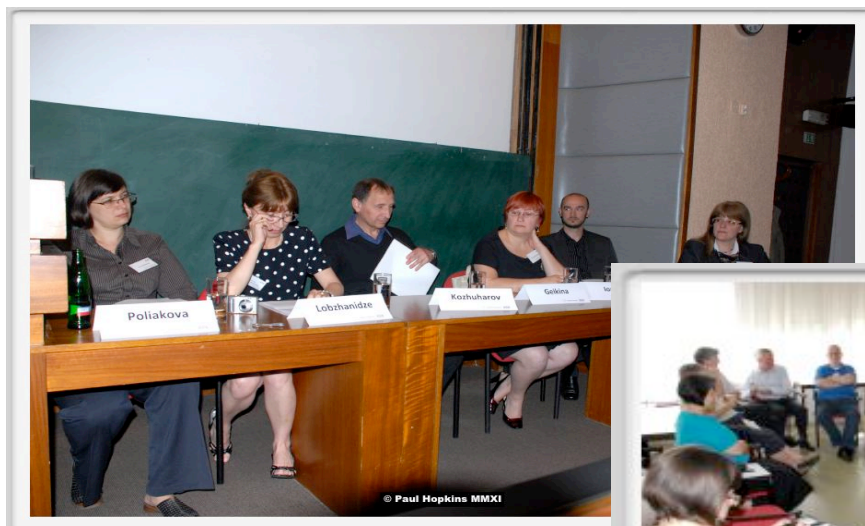
Ci dessus : table ronde sur la situation actuelle de l'enseignement religieux en Géorgie, Lettonie, Russie, Bulgarie, Hongrie, Roumanie

Le programme comprit également des ateliers et une table ronde d'introduction à